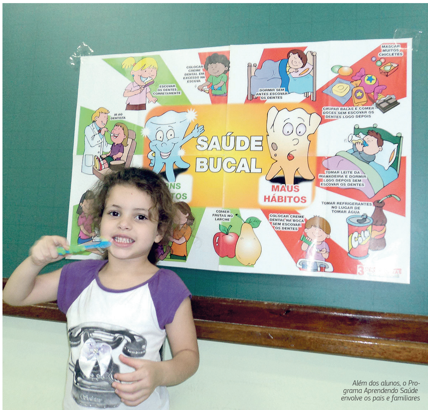
Além dos alunos, o Programa Aprendendo Saúde envolve os pais e familiares