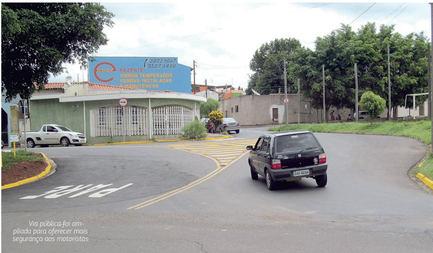
Via pública foi ampliada para oferecer mais segurança aos motoristas