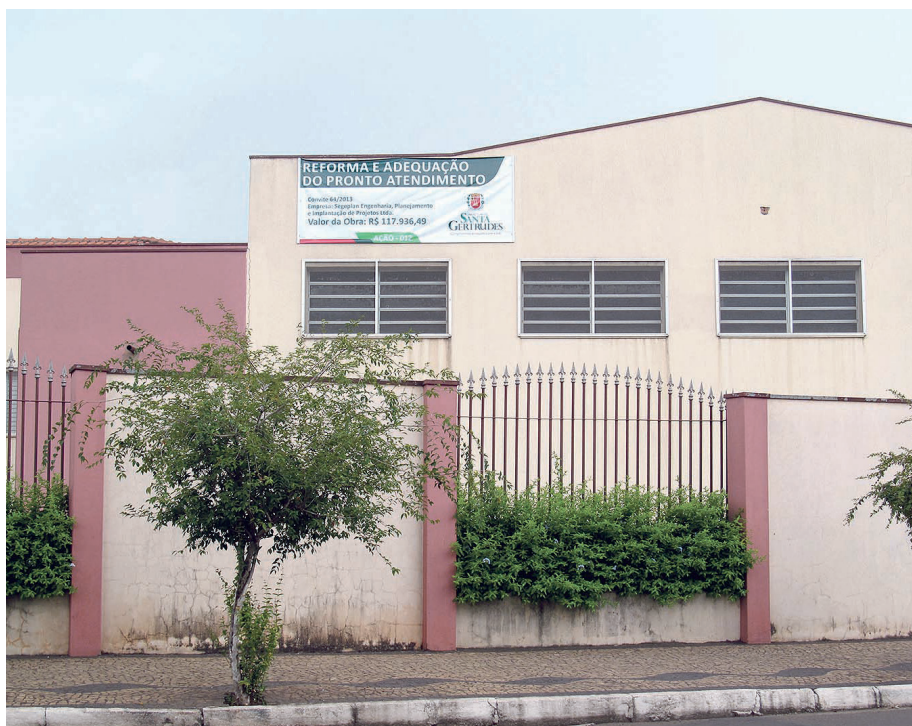
Pronto Socorro Municipal vai passar por reforma e ampliação