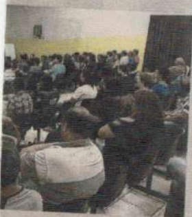
...m ser desenvolvidas